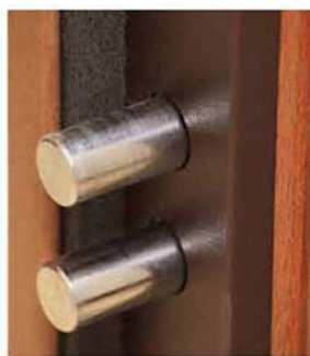
Particolare doppio deviatore