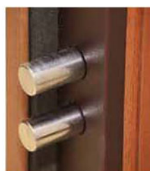
Particolare doppio deviatore