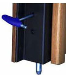
paletti di chiusura