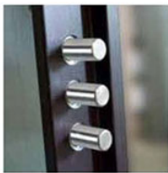
kit triplo deviatore