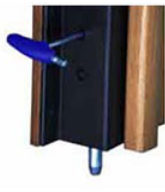
paletti di chiusura